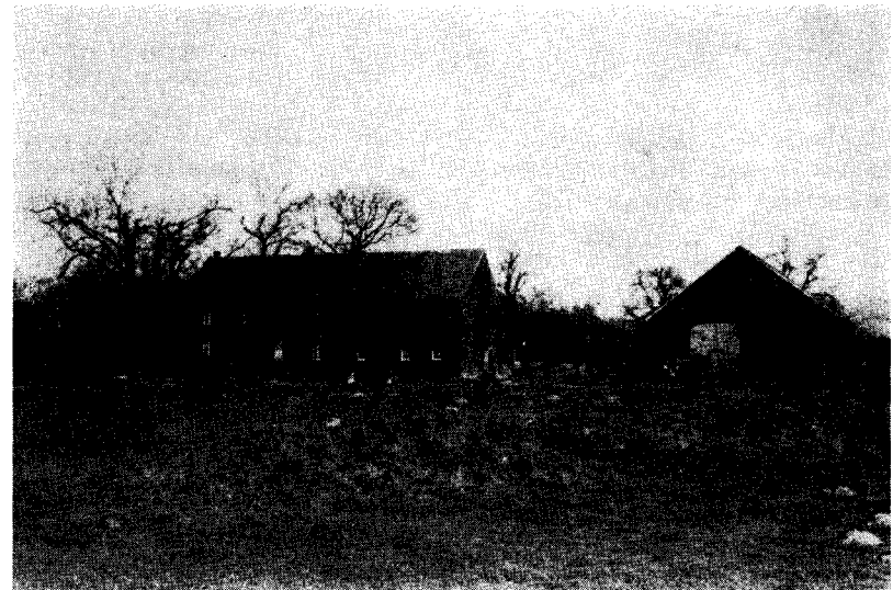
Willems- oder Dümpelmanns Hof

Auf Grund der Zugehörigkeit zum Kloster Marienkamp ist in dessen Büchern eingehend über den Hof geschrieben. Im Lagerbuch von 1590 heißt es u. a.: Das