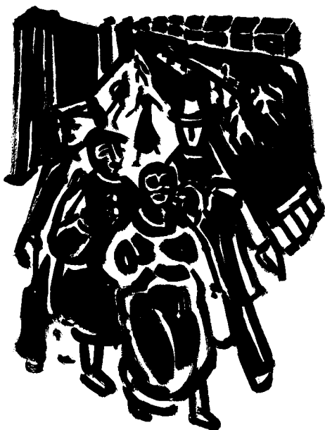
In der Zechensiedlung