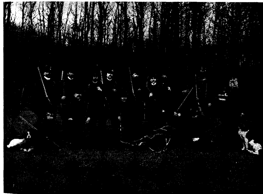
Erinnerungsbild von einer Hirschjagd im Bruckhausener Wald im Jahre 1906