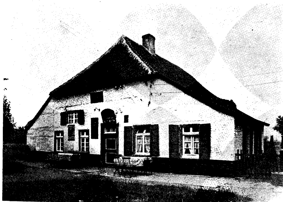
„Zum Franzmann“ an der B8 in Friedrichsfeld