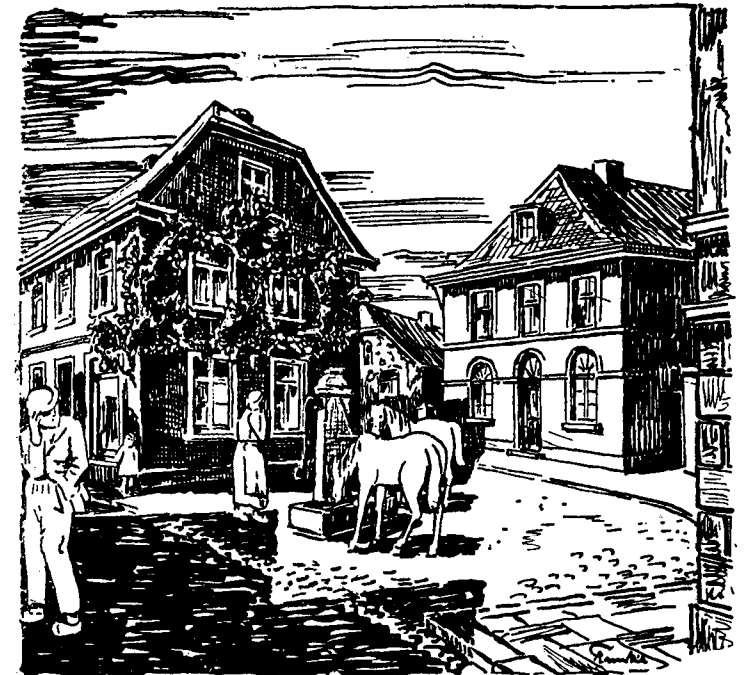
Idylle vor 100 Jahren: An der „Wöllepump“ in Dinslaken