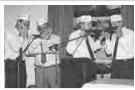
Nach vierzig Jahren, Mundharmonika wird immer noch gespielt.

Entschuldigungszettel eines Walsumer Schülers aus dem Jahr 1905: „Geben Sie meinem Sohn Urlaub! Ich muss mit dem Schwein nach Dinslaken zum Markt. Meine Frau liegt im Kindbett und ich muss mich auch in Acht nehmen.“