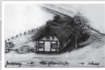
Versuchte bildliche Darstellung wie die Wirtschaft im Jahre 1600 ausgesehen haben könnte.