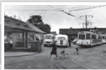
Das Walsumer Straßenbahndepot im Jahre 1956. Heute befindet sich dort die Firma Aldi.