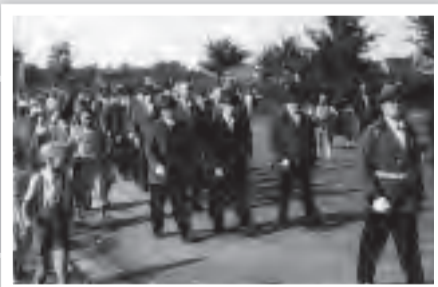
Neuanfang 1949. Festumzug auf der Dittfeldstr. Hüte waren meist noch vorhanden.

Eine wesentliche Neuerung brachte das Jahr 1910. Erstmals wurden Schützenfest und Aldenrader Kirmes gleichzeitig gefeiert, als gemeinsames Schützen- und Volksfest. Heute scheint es undenkbar, dass Schützenfest und Kirmes jemals getrennt gefeiert wurden. König wurde in diesem Jahr Wilhelm Kolkmann, der sich Ida Atrops als Königin erwählte. Sein Königsorden ziert als ältester Orden heute noch die Königskette.