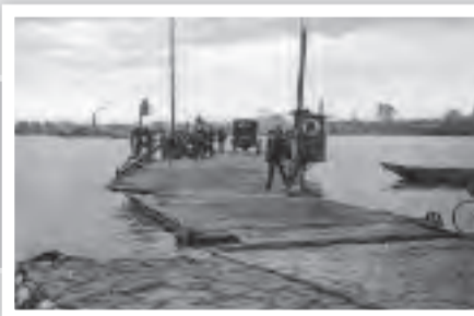
Die Fähre im Jahre 1928 mit Blick nach Orsoy.