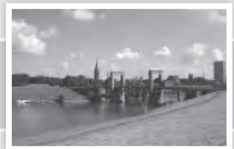
Die Hubbrücke heute.