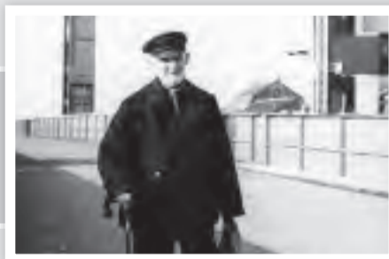
Kurz vorher erfolgte aber schon die erste Begehung. Leider ist uns der Name des Mannes nicht bekannt.