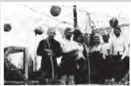
Rosenmontagszug. Auf der Provinzialstr. (heute Fr. Ebert Str.) im Jahr 1937. Motto des Jahres war „Walsum ist glücklich wie noch nie“.

Es stimmt, was ein ehemaliger Präsident der „KG Alt Walsum“ sagte: „Den Walsumern liegt der Karneval im Blut“