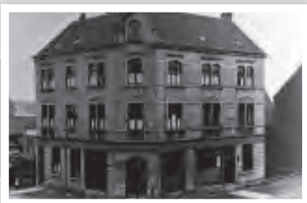
Walsums Rathaus in den 30er Jahren Ecke Fr. Ebert Str. – Schloßstr.

Aus einer Schrift des 9. Jahrhunderts (Sanskrit-Codex)