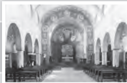
So sah das Innere der Kirche vor der Zerstörung im 2. Weltkrieg aus.