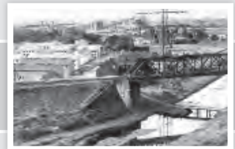
Im Jahr 1949, die Brücke der Bundesbahn ist schon wieder in Betrieb. Die Straßenbrücke der Dittfeldstr. ist nur als Notsteg für Fußgänger hergerichtet.