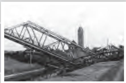
Das Ende. Im März 1945 wurden sämtliche Brücken über die Emscher gesprengt. Hier die Brücken über die Dittfeldstr.