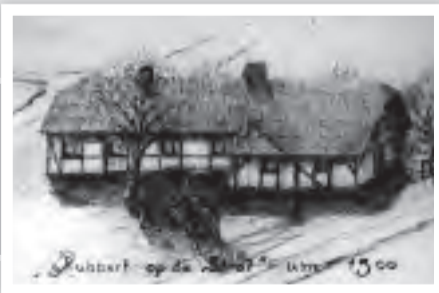
Versuchte bildliche Darstellung wie die Wirtschaft im Jahre 1500 ausgesehen haben könnte.

Der Wirt betrieb eine Fuselbrennerei bzw. Bierbrauerei (Fusel gleich Schnaps). Über viele Jahrzehnte hinweg wurde im September am Rubbert Kirmes gefeiert. Der Ursprung des Namens „Rubbert“ wahrscheinlich „Robert“.