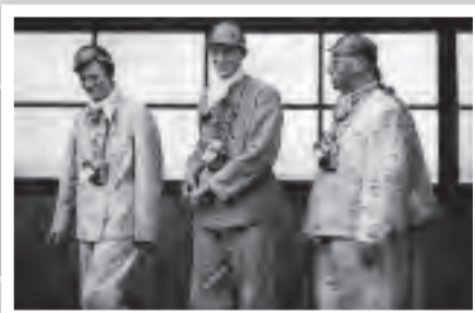
Baron Thyssen mit Ehefrau besucht die Schachtanlage. Rechts: Dr. Roelen.

Auszug aus dem Weihnachtsbrief des Kreises Dinslaken für seine Kriegsgefangenen im Jahre 1948