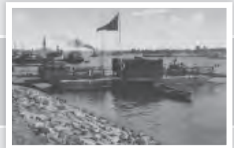
Die Fähre im Jahre 1924.