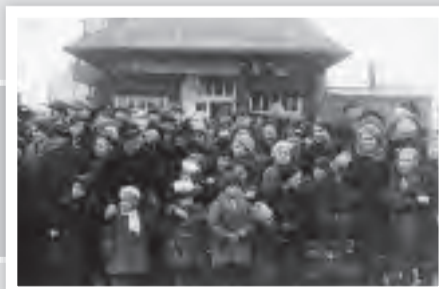
Rosenmontagszug im Jahre 1937. Die Walsumer, aber nicht nur die Walsumer Bevölkerung, nahm großen Anteil am Karnevalstreiben.