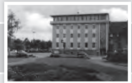
Umbau der Sparkasse zum Rathaus. Verkleidung der Fassade und Aufstockung des Hauses.