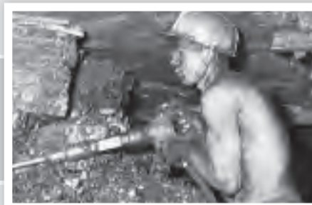
Bergmann unter Tage.