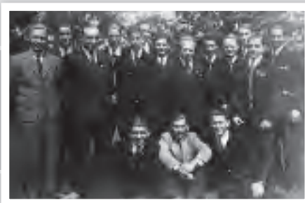
Das Orchester im Gründungsjahr.