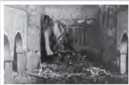
Das Innere der Kirche nach dem Bombenangriff im 2. Weltkrieg.