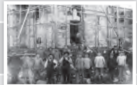
„St. Josef“ im Bau. Ein Jahr vor der Fertigstellung im Jahr 1914.