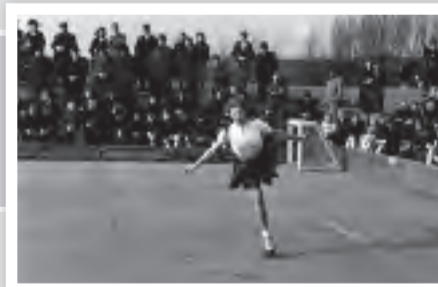
Rollkunstlauf auf der Bahn am Stadion an der Römerstrasse.