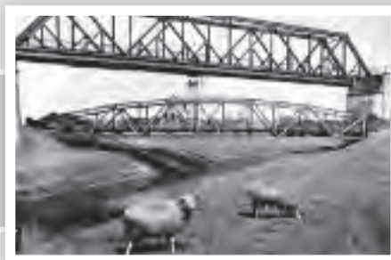
Die Emscher von Jahren (im Jahr 1939) ein Abwasserkanal.