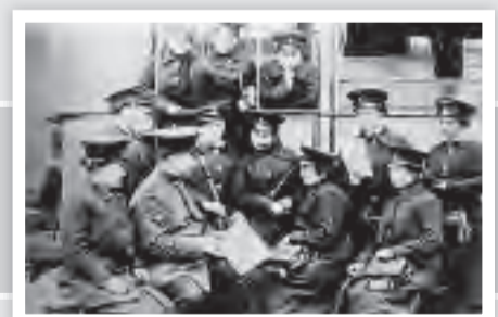
Personal der Kreis Ruhrorter Straßenbahn im ersten Weltkrieg 1914/18. Nur Frauen, die Männer waren eingezogen.