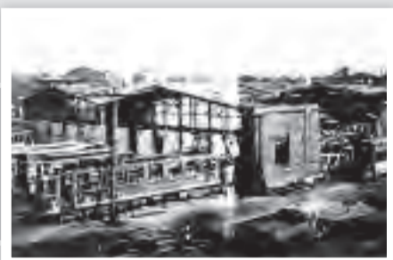
Das Walsumer Straßenbahndepot an der Friedrich Ebert Str. im April 1945, nach dem zweiten Weltkrieg.

Die Fahrpreise im Personenverkehr waren Traumpreise. Ein Fahrschein vom Schwan bis zum Straßenbahndepot kostete 10 Pfg. Eine Monatskarte 4 Mark und eine Jahreskarte 40 Mark. Da kurz vor dem Ende des zweiten Weltkrieges alle Brücken über die Emscher gesprengt worden waren, wurde der Straßenbahnverkehr nicht wieder aufgenommen. Es wurde eine Autobus-Linie eingerichtet.