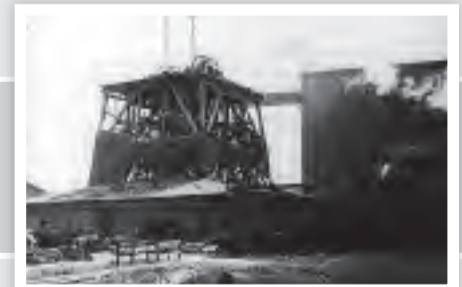
Montage des Fördergerüsts im April 1938.