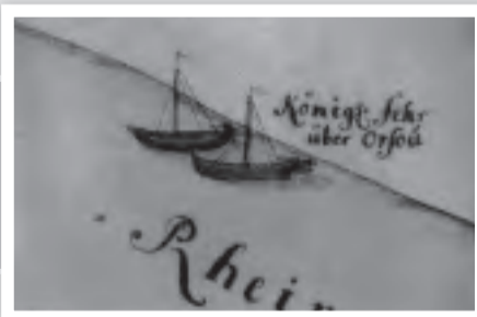
Das älteste Bild der Walsum-Orsoyer Fähre aus dem Jahr 1751.