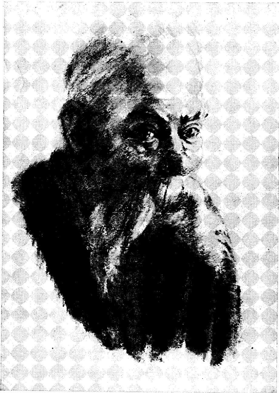
Ein alter Niederrheiner aus Götterswickerhamm

(Nach einer Kohlezeichnung von Hermann Scholten, Voerde)