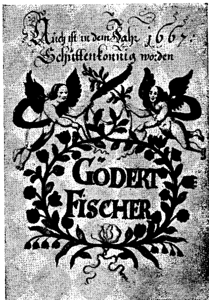
So verewigte sich der Schützenkönig von 1667 im Dinslakener „Königsbuch“

„Ein jeder unter dieser Bruderschaft gehöriger soll mit einem glatten rohr und einzoler Kugel dreimahl nach der scheiben schießen mögen, wer aber eine gezogene Büchse oder Draetkugel gebrauchen würde, dessen schuß sol nicht allein für nicht gültig gehalten werden, sondern er sol auch sofort eine neue scheiben anschaffen, und dabei des Tages Köste nebens einen pfennig an das Silber von zwei Taler zur Strafe bezahlen.“