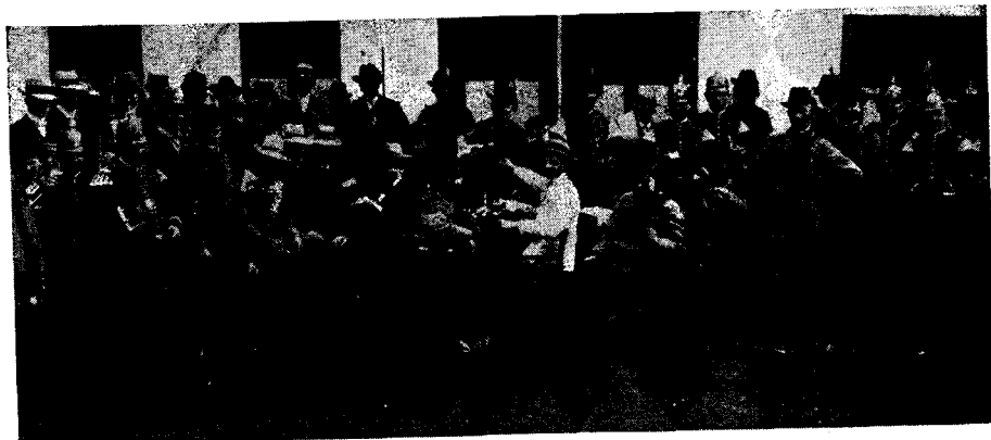
Fröhliche Schützenrunde um 1900

Über die Instandhaltung der Rüstung wurde streng gewacht. Die Musterungen fanden häufig an den Tagen des Schützenfestes statt.