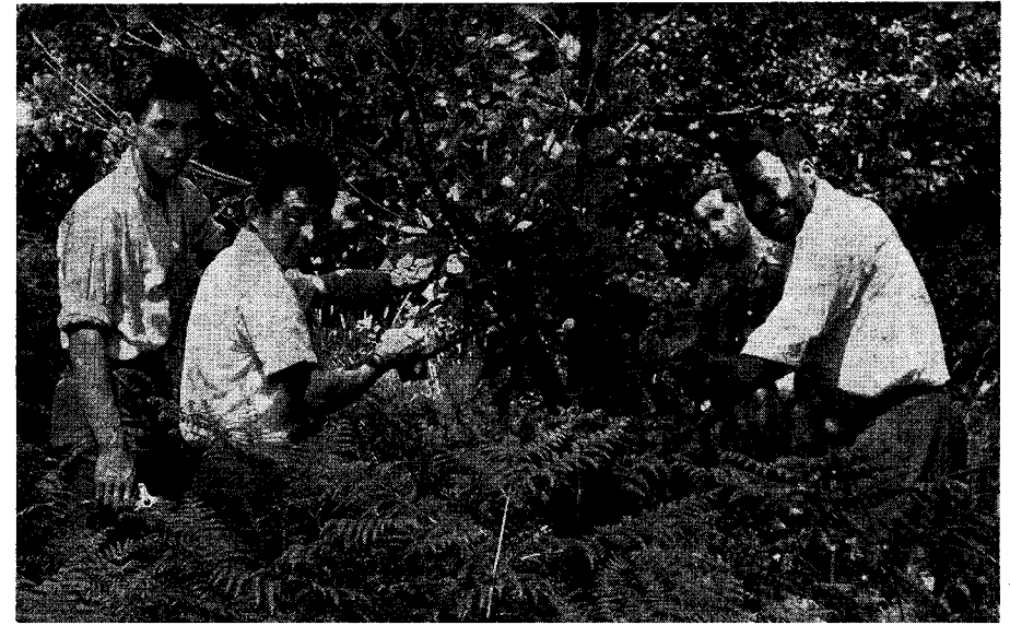
Nicht am Kongo, sondern am Rotbach. - Vier Studenten aus vier Nationen, die im Lohberger Pestalozzidorf wohnten, bei Aufforstungsarbeiten.

die ihren rührigen Tanzkreis zu den Gästen gesellten. Gemeinsam wurden vor überfüllten Sälen Volkstänze und Volkslieder vorgeführt, in wohlthuender Schlichtheit und ohne die fotogene und auf das Fernsehen berechnete Politur, ohne die es heute auf Treffen ähnlicher Art offenbar nicht mehr geht.