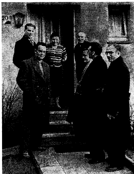
Russische Studenten im Pestalozzi-Dorf

Dieser erste europäische Kontakt hatte manchen Schweißtropfen gekostet, und zwar buchstäblich, denn es herrschte in diesem Juni eine wahrhaft tropische Hitze in Europa, und die Knappen spielten in der schwarzen Bergmannstracht. Aber der Kontakt war