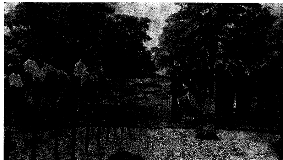
Die Lohberger Knappenkapelle spielt das Lied vom guten Kameraden auf dem Heldenfriedhof Neuville St. Vaast

Ein Teil unserer Belegschaftsangehörigen stammt aus Südtirol. Sie zu besuchen, kam eine Volkstanz- und Singegruppe aus Brixen zu uns und blieb eine ganze Woche zu Gast. Es war eine Freude auch für die Lohberger,