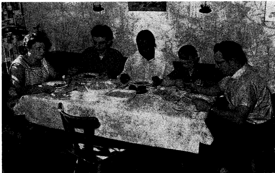
Am Mittagstisch im Pestalozzidorf: ein Student aus Nigeria gehört für vier Wochen mit zur Familie