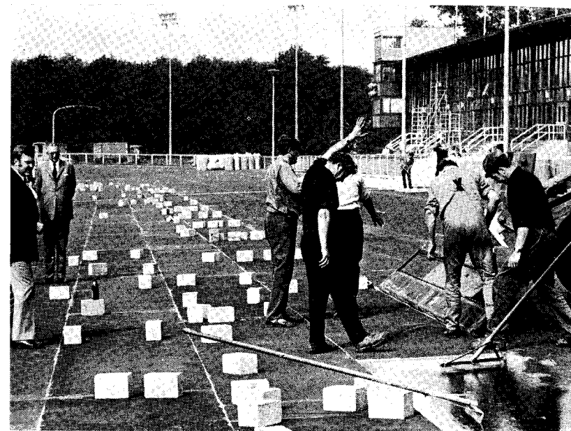
Die Trabrennbahn Dinslaken ist die erste Kunststoffbahn Europas! 16.400 m 2 „Astroflex“ verlegten fleißige Hände in knapp fünf Wochen.

Viele Faktoren haben beim kometenhaften Aufstieg des Bärenkamps zusammengewirkt. Hervorragender Service für die Besucher, packender Sport und der als richtungweisend anerkannte Fortschritt in allen renntechnischen Belangen sind in diesem Zusammenhang die markantesten Stichpunkte. Jüngstes Beispiel für den Siegeszug der Technik auf der Dinslakener Trabrennbahn ist die Errichtung der ersten Kunststoffpiste in Europa. In knapp fünf Wochen erhielt das Rennoval eine völlig neue Grundlage aus „Phoenix-Astroflex“ – so heißt die Zauberformel für den Kunststoff, der am Bärenkamp verlegt wurde. Der Belag stellt eine Spezialmischung auf der Basis eines