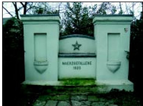
Das Denkmal für die Märzgefallenen auf dem Friedhof Alt-Walsum