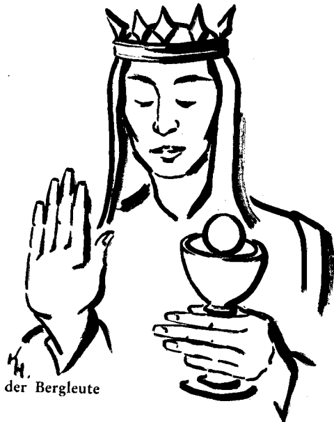
Barbara, die Schutzpatronin der Bergleute

Gerade nach diesem Kriege konnte jedermann erkennen, wie bedeutsam seine Aufgabe ist. Er, der Bergmann, schuf die ersten neuen Voraussetzungen für Leben und Zukunft unseres Volkes. Dazu mußte er noch Ungezählte in die Arbeit einführen, ausbilden und ausrichten, junge Leute, denen Heimat und Beruf, Eltern und Glauben genommen worden war, die ihre ungeübten Hände mitanlegen mußten, damit das Volk einen neuen Anfang finden konnte.