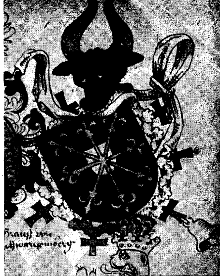
Das Wappen der Herzöge von Kleve (Aus Grünenbergs Wappenbuch)

Der Neubau des Kreishauses in Dinslaken lenkt den Blick wieder einmal auf das alte Kastell und das Geschlecht, das einst dort seinen Sitz gehabt hat. Im Jahre 1948 hat die 675-Jahr-Feier der Stadterhebung daran erinnert, daß Dinslaken im Jahre 1273 von Graf Dietrich VI. von Kleve zur Stadt erhoben worden ist. Wie aber sind Burg und Stadt Dinslaken in den Besitz der Grafen von Kleve gelangt?