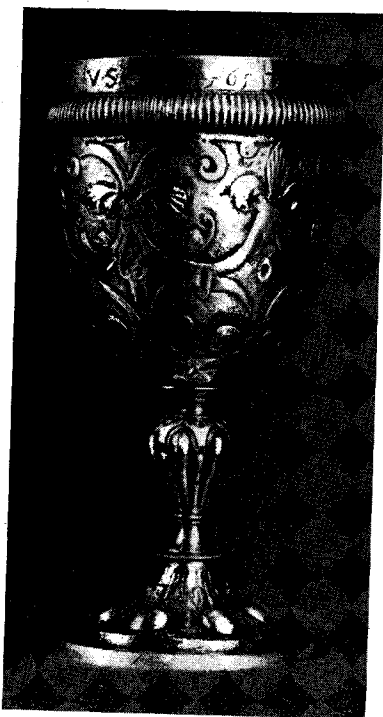
Der Abendmahlskelch aus dem Jahre 1653