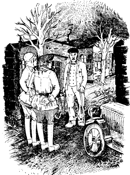
Besuch bei den Flüchtlingen im Barackenlager

Damit besaß die Kreissiedlungsgesellschaft ein Gelände von 914 ha, außerdem das gesamte Lager Friedrichsfeld mit allen Baracken, dem Offizierskasino und anderen Gebäuden.