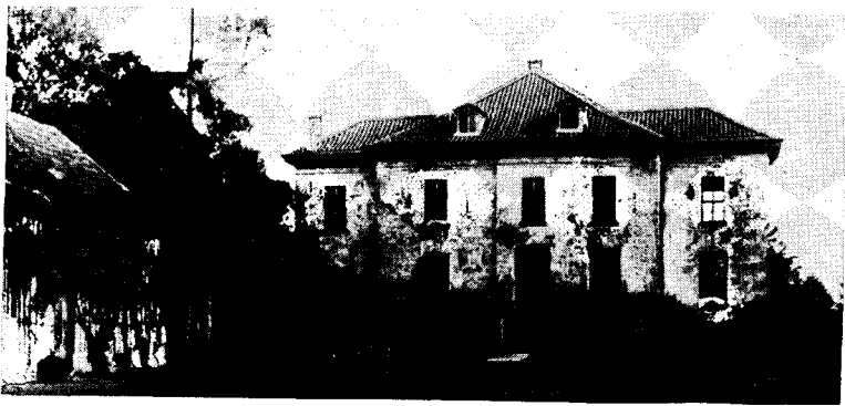
Haus Bärenkamp 1893