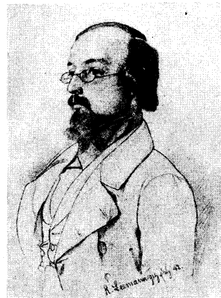
Der 23jährige GOTTFRIED KELLER