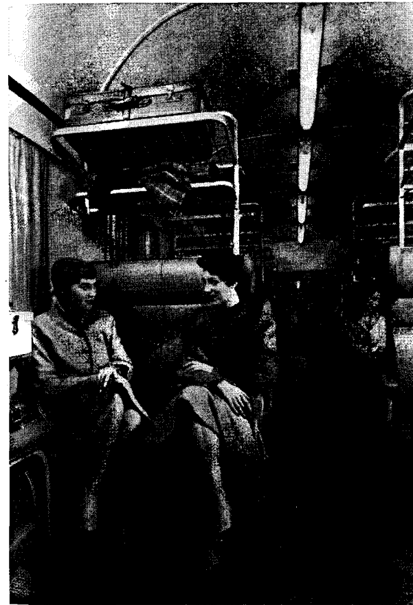
PINTSCH-Leuchten in einem Eilzugwagen geben eine gleichmäßig helle und angenehme Beleuchtung.

Noch ist das Ende der Entwicklung nicht abzusehen; denn auch in Deutschland beginnt man, wie bereits in den USA seit längerem eingeführt, die Eisenbahnwagen zu belüften und zu klimatisieren. Das heißt, im Winter müssen die Wagen geheizt und im Sommer gekühlt werden. Gleichzeitig wird durch Zufuhr von Frischluft dem Reisenden auf langen Fahrten ein Höchstmaß an Behaglichkeit geboten. Wenn auch in Deutschland, bedingt durch das gemäßigtere Klima und die verhältnismäßig kurzen Strecken, die Klimatisierung keine so große Rolle spielt, so ist dieses Gebiet besonders für den Export — der ein Großteil der Lieferung der PINTSCH BAMAG ausmacht — doch von Bedeutung.