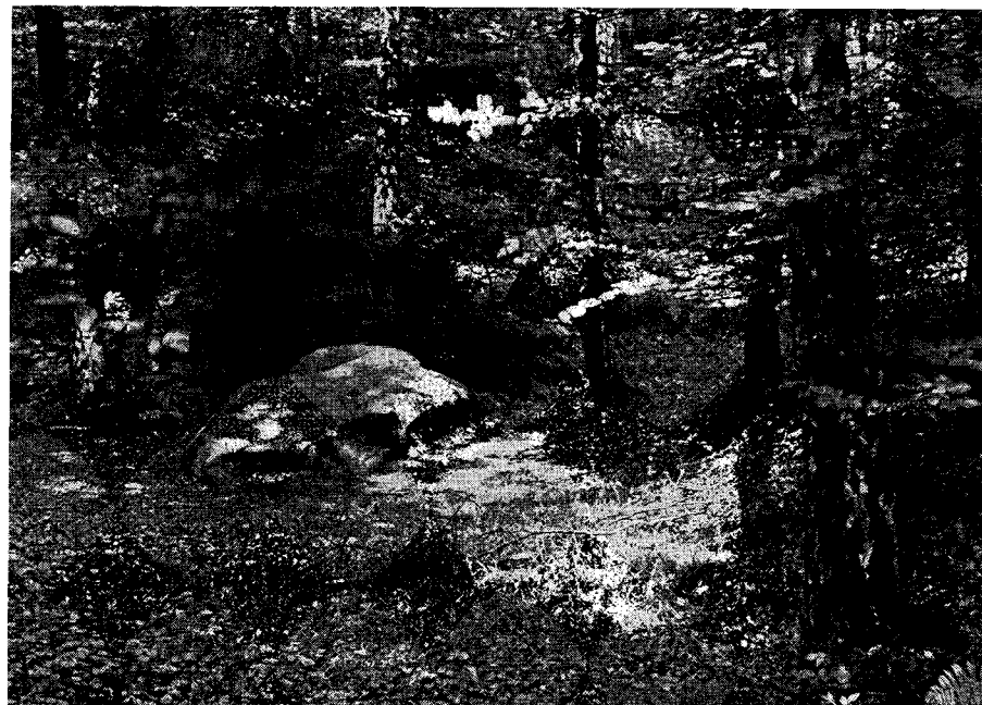
Die Teufelssteine im Hünxer Wald

Wo er Böses zu schaffen gewillt ist, da hat er der Sage nach bis heute seine Spuren hinterlassen. Im Volksmund gibt es heute noch bei Wyler im Kreise Kleve, dicht bei der holländischen Grenze, den Teufelsberg,